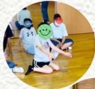
ケンケンパしたり