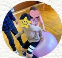
バランス運動したり