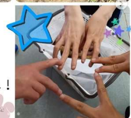
おやつやお昼にみんなで食べようね！