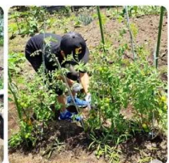
つぼみファームのじゃがいもやトマトを収穫しました！