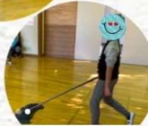
もちろん 掃除も忘れずに