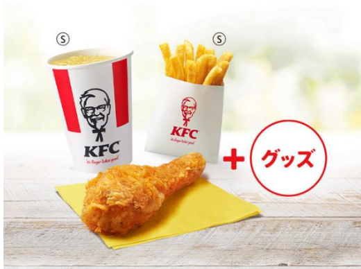
キッズオリジナルチキンセット 価格¥590