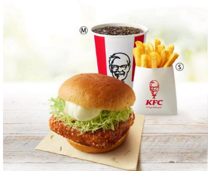
和風チキンカツバーガー セット 価格¥850