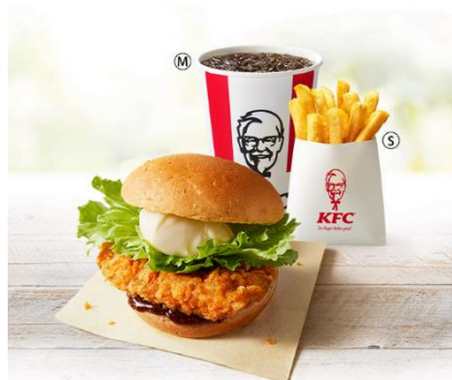
ガーリックペッパーチキン フィレバーガーセット 価格¥900