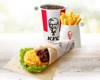
てりやきツイスターセット 価格¥790