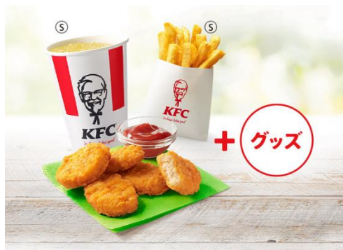
キッズナゲットセット 価格¥590