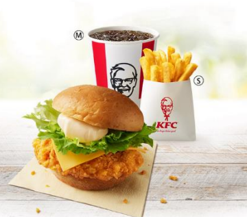
チーズチキンフィレ バーガーセット 価格¥880