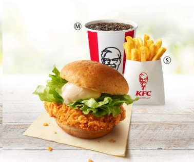
チキンフィレバーガー セット 価格¥850