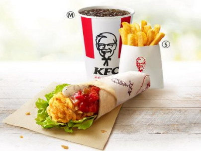
ペッパーマヨツイスターセット 価格¥790