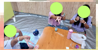
8月14日・15日 会場内の様子